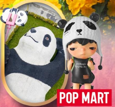
POP MART หมีแพนด้าเซลฟ์