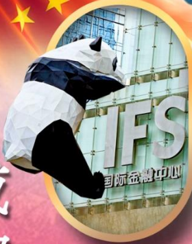
IFS หมีแพนด้าป็นดึก