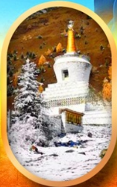
อุทยานสี่ครุณี