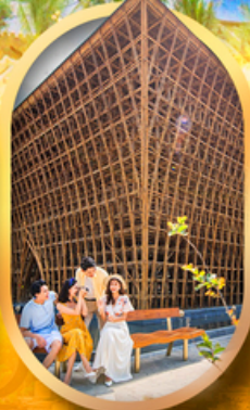
อาคารไม้ไผ่