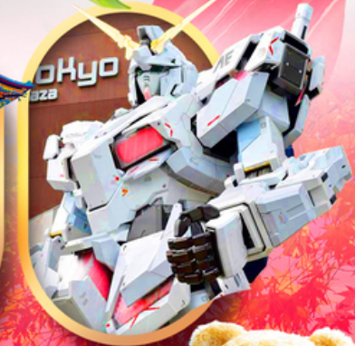
ห้างไอโดบะกันดั้ม