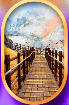
หุบเขานรกจิงคุดานิ