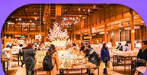
พิพิธภัณฑ์กล่องดนตรี Otaru Music Box Museum