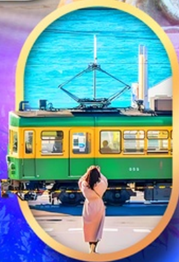
ถนนโคมาจิโคริ