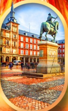
พลาซามายอร์