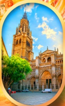
มหาวิหารโตเลโด