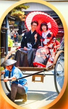
เมืองเก่าทาคายามา