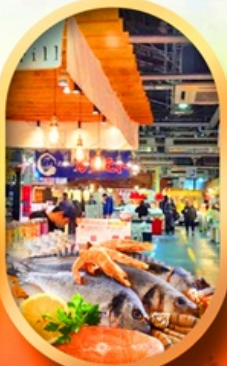
ตลาดปลาฮงโศ