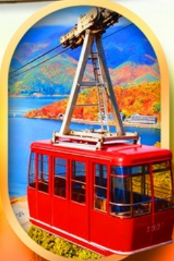
ขึ้นกระเช้าทะเลสาบมิกะตะ