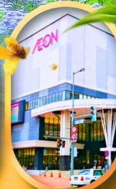
อ็อนมอลล์