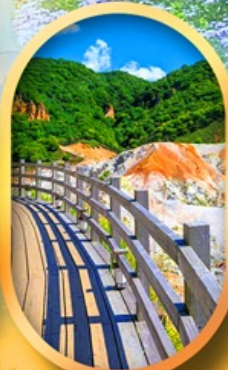
โนโบริเบทสึ