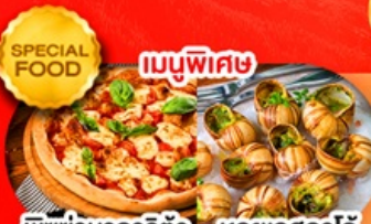
พิซซ่ามาการิตต้า หอยยอสคาโก้