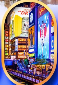
ย่านชินโซบาชิ