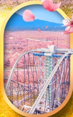
ฟูจิยาม่า ทาวเวอร์