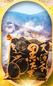
หุบเขาโอวาคุดานิ