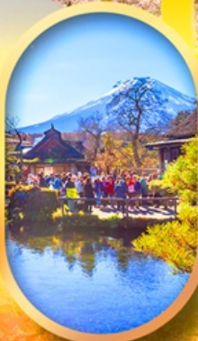
หมู่บ้านน้ำใส