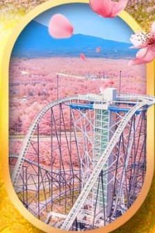
ฟูจิยาม่า ทาวเวอร์