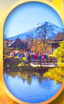
หมู่บ้านน้ำใส