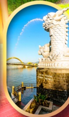
คาร์พดราท็อน