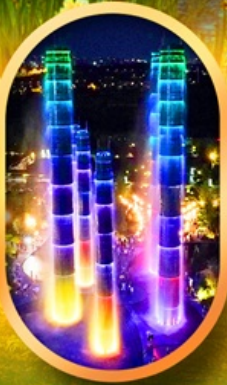
SKP Global Center