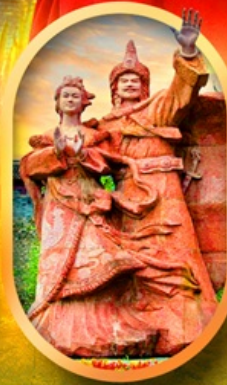
เมืองโบราณชางพาน