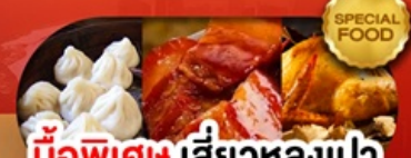
มือพิเศษ เสี้ยวหลงเปา หมูตงพอ ไก่จอกาน เดินทาง ม.ค. - มิ.ย. 69