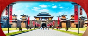
Hengdian World Studios โรงละครจำลองที่ใหญ่ที่สุดในโลก

เชียงใหม่ ทางใจ หึงเตียน ล่องเรือทะเลสาบซีหู