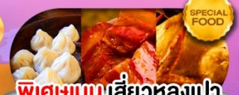
พิเศษเมนูเสี่ยวหลงเปา หมูตงฟอ ไก่ขอกาน เดินทาง ม.ค. - มิ.ย. 69