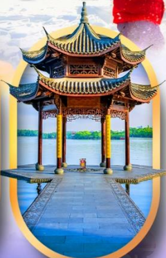
ล่องทะเลสาบซีหู