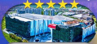
Crowne Plaza Snow World Hotel หรือเทียบเท่า ระดับ 5 ดาว 1 คืน

เชียงใหม่ ดิสนีย์แลนด์ ไอซ์แอนคส์โนวเวิลด์