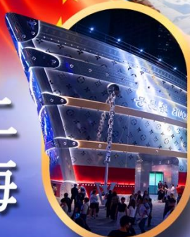
เรือคอะหลุยส์