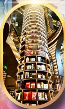
หอหนังสือจางชูก่อ