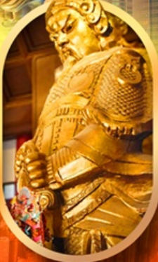
ทองพระวัดแซง

เที่ยว 2 ประเทศ ทองพระ วัดตั้ง ซุปปังจุใจ