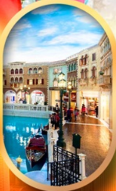
เดอะเวนิเซียน