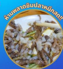
ซันนิกจิ อาหารท้องถิ่น

ชมดอกคามิเลียที่เกาะดองแบกโซม โพฮังสเปซวอล์ก” สกายวอร์ค นั่งเคเบิลคาร์ ชมทะเลปูซาน ห้ามพลาด!! ตลาดปลาที่ใหญ่ที่สุด ถ่ายรูปชิคๆ หมู่บ้านวัฒนธรรมคิมซอน เชคอินแหล่งสุดปัง The Bay101 ช้อปปิ้งตลาดพื้นเมือง อิสระช้อปปิ้ง Lotte Duty Free