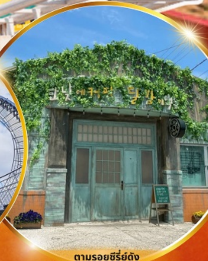
ตามรอยซีรีส์ดัง Hometown chacha

โพฮังสเปซวอล์ค สกายวอร์ค ตามรอยซีรีส์ Hometown chacha ถ่ายรูปชิคๆ หมู่บ้านวัฒนธรรมคิมซอน ขึ้นเคเบิลคาร์ ชมทะเลปูซาน นั่งรถไฟปูคปิก sky capsule ชิมของอร่อยตลาดแฮอนแด แหล่งช้อปปิ้งใต้ดิน ชัมยอน อิสระช้อปปิ้ง Lotte Duty Free