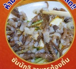
ชั้นนักชี อาหารท้องถิ่น