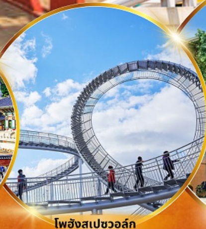
โพฮังสเปซวอล์ค