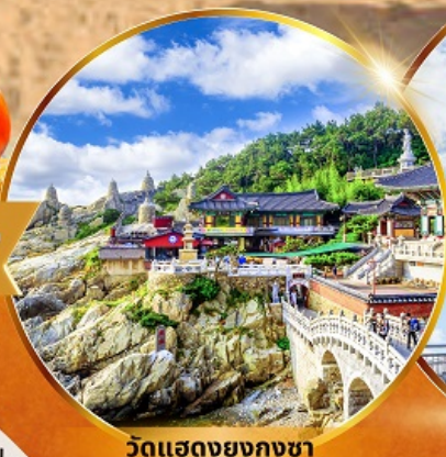
วัดแฮดงยงกุงซา