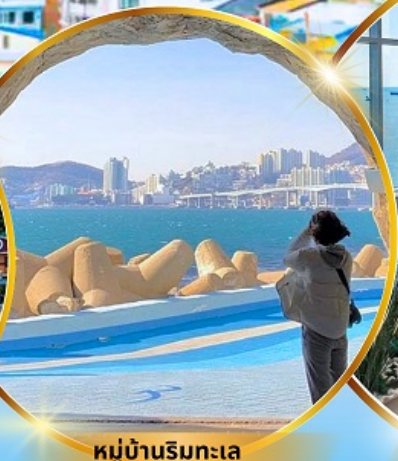
หมู่บ้านริมทะเล