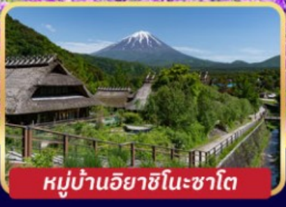
หมู่บ้านอียาชิโนะซาโต