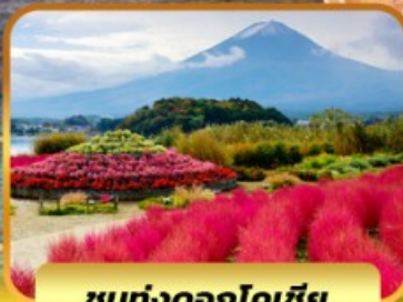
ชมทุ่งดอกโคเชีย