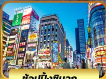
ช้อปบั้งชินจูกุ