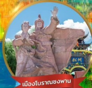
เมืองโบราณชงฟาน