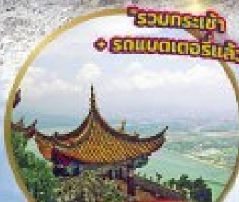
ยอดเขาชี้ชาน