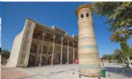
สุเหร่าไม้