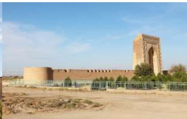
สุหร่าบิบิ คะนุุม