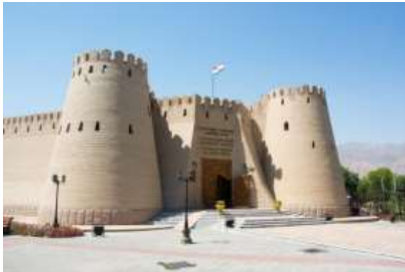
ปราสาททาเมมาริค

นำท่านเข้าสู่ที่พัก Parliament Palace Hotel หรือเทียบเท่า