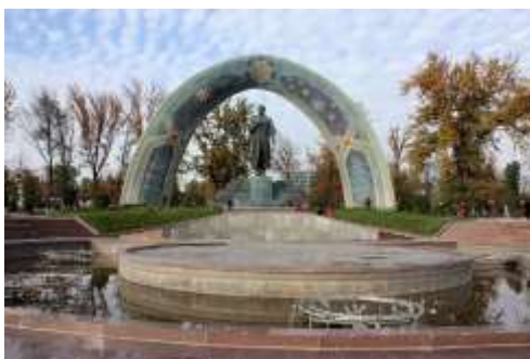
สวนสาธารณะรูดากี