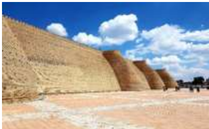
ป้อมดิอาร์ค

นำท่านชม ด้านนอกและถ่ายรูปกับ ป้อมดิอาร์ค ป้อมปราการแห่งบูคาร่า (Ark of Bukhara) ซึ่งเป็นป้อมเก่าแก่สร้างในศตวรรษที่ 5 ตั้งอยู่ใจกลางเมือง และเมื่อขึ้นไปด้านบนของป้อมจะสามารถเห็นวิวทิวทัศน์ของเมืองได้อย่างชัดเจน มีกำแพงล้อมรอบมีความยาวประมาณ 800 เมตร ส่วนของกำแพงมีความสูงถึง 16-20 เมตร ถูกสร้างด้วยอิฐหนาที่บดและสูงใหญ่ ส่วนประตูมีซุ้มโค้งและหอคอยทั้งสองด้าน ซึ่งในอดีตภายในถูกใช้เป็นศูนย์กลางการปกครอง ชม สุเหร่าไม้ (Bolo Hauz Mosque) เป็นอาคารสุเหร่าในสมัยกลาง ถูกสร้างขึ้นในปี ค.ศ. 1712-1713 รูปแบบในการก่อสร้างประกอบไปด้วยเสาไม้ที่มีความสูงมาก อาคารด้านหน้ามีเสาไม้ประดับมากกว่า 20 ต้นรองรับแดดฟ้าหลังคา ต่อมาในปี ค.ศ. 1917 ก็ได้ใช้สถานที่แห่งนี้เป็นสุเหร่าอย่างเป็นทางการมาจนถึงปัจจุบันนี้ ชม หอโพลิ คัลยาน (Poli Kalyan Ensemble and Kalon Minaret) ถูกสร้างขึ้นในปี ค.ศ. 1127 โดย อาสถาน ช่าน แห่งราชวงศ์คารานิด อยู่ในการปกครองของบูคาร่า และสามารถทำให้ผู้พบเห็นต้องตกตะลึงถึงความโอ่างดงามในรูปร่างของหอนี้ ส่วนที่สูงที่สุดเป็นทรงกลม หอนี้ได้ถูกออกแบบเพื่อใช้ในการทำละหมาดของชาวมุสลิม หอคอยแห่งนี้ได้ถูกซ่อมแซมขึ้นใหม่ในศตวรรษที่ 15