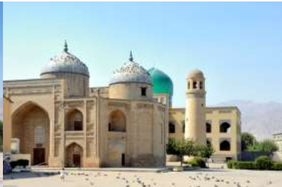
Sheikh Muslihiddin Mausoleum