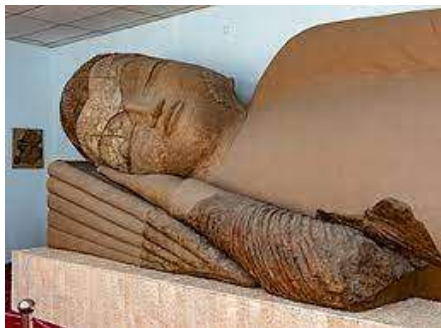
พิพิธภัณฑ์โบราณวัตถุแห่งชาติ

นำท่านเข้าสู่ที่พัก Atlas Hotel หรือเทียบเท่า