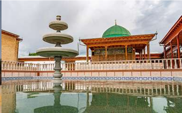
กลุ่มอาคาร khazrati shoh