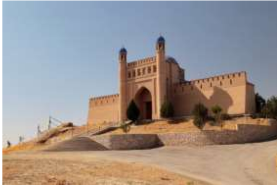
ป้อมปราการมัคเทปเป

นำท่านเข้าสู่ที่พัก Atlas Hotel หรือเทียบเท่า