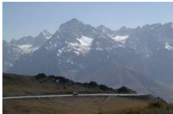
ช่องเขาแอนซอพพาส