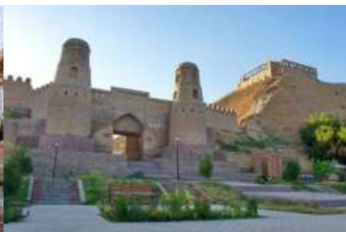
ป้อมปราการฮิสซาร์