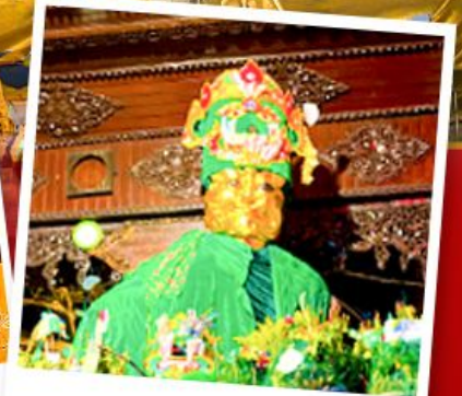
ขอพรแม่ยักษ์