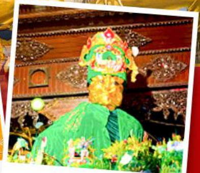
ขอพรแม่ยักยี