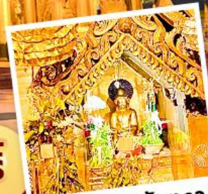
พระสุริยันจันทรา