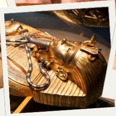
พิพิธภัณฑ์สถานแห่งชาติอียิปต์