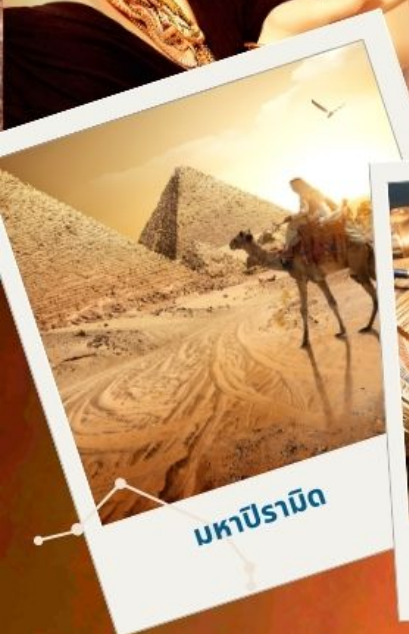
มหาปิรามิด