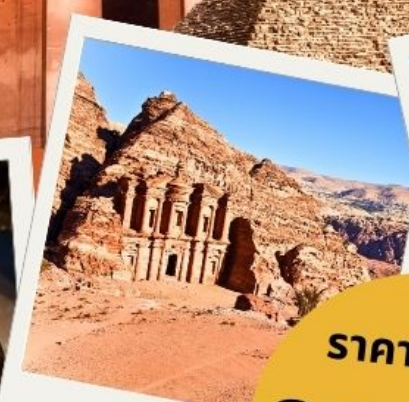
เขตรา นครศิลาสิมพู