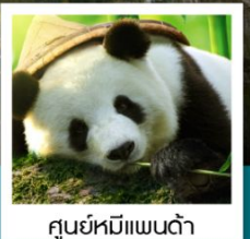
ศูนย์หมีแพนด้า