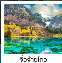
จิวจ้ายโกว