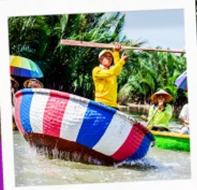
เรือกระดิง