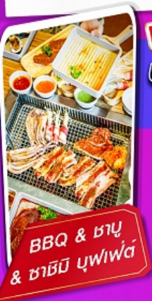
BBQ & ซาบู & ซาชิมิ บุฟเฟ่ต์