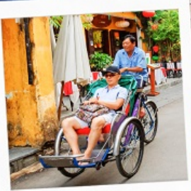
รถสามล้อ Cyclo