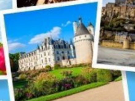
ปราสาทชองโซ