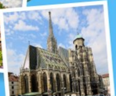
มหาวิหารแมกทิส

เยอรมนี ออสเตรีย เชก สโลวาเกีย ฮังการี 11 วัน 8 คืน