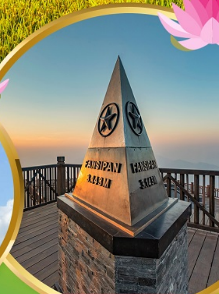
ฟานชิปัน