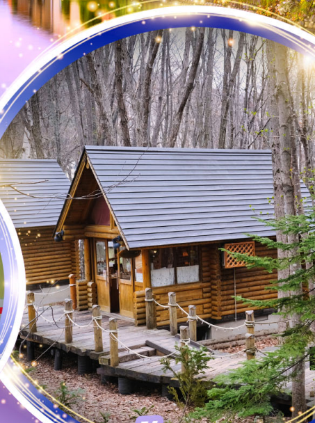
นิงเกิ้ลทอเรีย