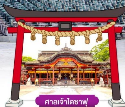
ศาลเจ้าไดซาฟุ