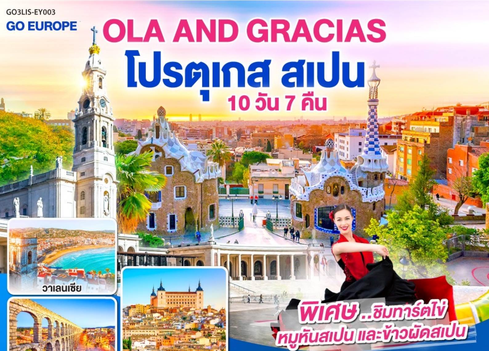
วาเลนเซีย