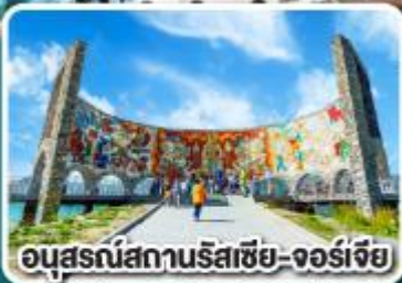
อนุสรณ์สถานรัสเซีย-จอร์เจีย