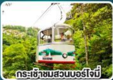
กระเช้าชมสวนบอร์โจมี