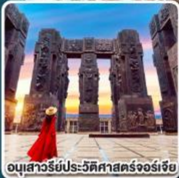
อนุสาวรีย์ประวัติศาสตร์จอร์เจีย

การ์นตี ห้องพักรีวิวเทือกเขาคอเคซัส ที่โรงแรม ROOMS