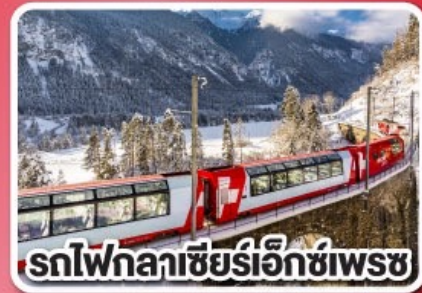
รถไฟกลาซีร์เอ็กซ์เพรส