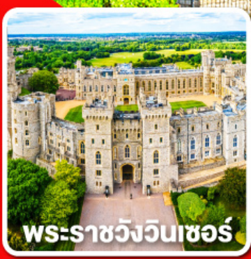
พระราชวังวินเซอร์

พักผ่อนนอน 4 คืนและ อิสระให้ท่านได้เที่ยวลอนดอนแบบเต็มอิ่ม 1 วัน