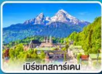
เบิร์ชเทสการ์เดน