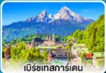
เบิร์ชเทสการ์เดิน

เยอรมนี ออสเตรีย ลิกเทินสไตน์ สวิตเซอร์แลนด์ 7 วัน 4 คืน