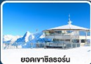
ยอดเขาซิลธอร์น