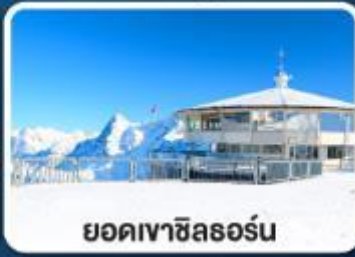
ยอดเขาซิลธอร์น

เข้าชมความสวยงาม พระราชวังเฮเรียนเคียมเซ่ "แวร์ชายน์แห่งเยอรมนี"