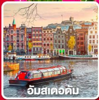
อัมสเตอร์ดัม

เยือนเมืองแปลกดินแดน 2 ประเทศ บาร์ล-นัสซา บาร์ล-เฮร์ตโท