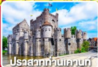
ปราสาทท่านเคานท์