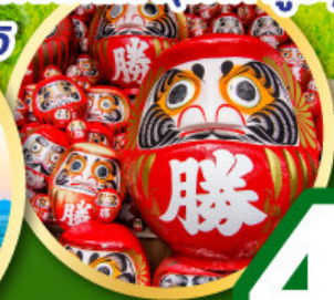
เที่ยวเต็มทุกวันไม่มีฟรีดิย์