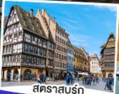
สตราสบูร์ก