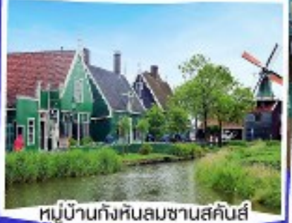
หมู่บ้านกังหันลมซานสคีนส์