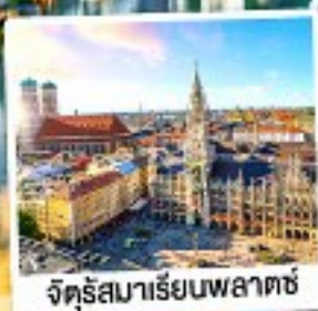
จัตุรัสมาเรียนพลาตซ์