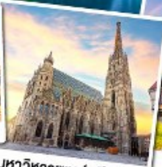
มหาวิหารเซนต์สตีเฟน