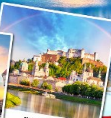
ซาลส์บวร์ก