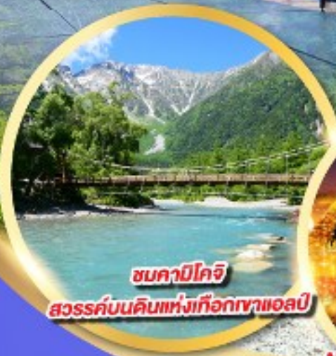
ชมคาบิโกจิ สวรรค์บนดินแห่งเทือกเขาแอลป์

นั่งกระเช้าลอยฟ้า 2 ชั้น ชินโฮทากะ หนึ่งเดียวในญี่ปุ่น แลนด์มาร์กยอดฮิตของโอคุซิดะ