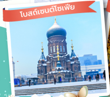
โบสถ์ซันตโซเฟีย