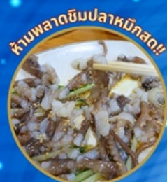
ห้ามพลาดชิมปลาหมึกสด!!

ชมซากุระจุใจ เทศกาลจีนแฮ ชมดอกคามิเลียที่เกาะดองแบกโซม แวะถ่ายรูปทุ่งดอกคาโนล่า เหลืองอร่าม นั่งเคเบิลคาร์ ชมทะเลปูซาน ห้ามพลาด!! ตลาดปลาที่ใหญ่ที่สุด เซคอินแหล่งสุดชิค The Bay101 ช้อปปิ้งตลาดพื้นเมือง อิสระช้อปปิ้งได้ดิน ชมยอน Lotte Duty Free