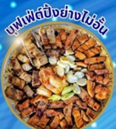
บุฟเฟ่ต์ปิ้งย่างไม่เว้น