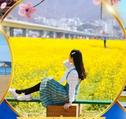
เทศกาลทุ่งดอกคาโนล่า