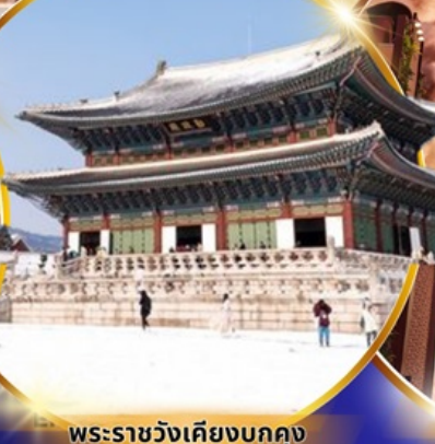
พระราชวังเคียงบกกุง