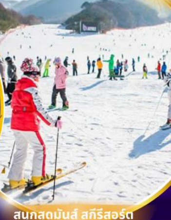
สนุกสุดมันส์ สกีรีสอร์ท

ชมจอ LED ขนาดยักษ์ที่รีสอร์ท 5 ดาว ใหญ่ที่สุดในเอเชียเหนือ สัมพัสมะสกีรีสอร์ท สนุกสุดมันส์ สวนสนุกเอเวอร์แลนด์ ชมพระราชวังคยองบกคุง ย้อนอดีตหมู่บ้านบุคซอน อันอก อิสระช้อปปิ้งคังนัม Lotte Duty Free