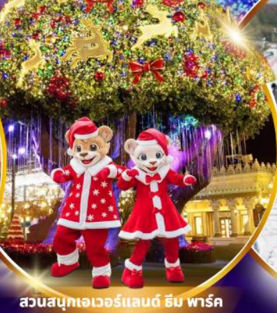
สวนสนุกเอเวอร์แลนด์ ฮิม พาร์ค