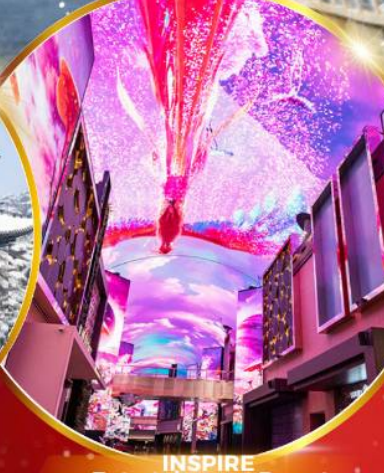
INSPIRE Entertainment Resort

ชมจอ LED ขนาดยักษ์ที่รีสอร์ท 5 ดาว ใหญ่ที่สุดในเอเชียเหนือ ชมพระราชวังคยองบกคุง เยือนอดีตหมู่บ้านบุคซอน ฮันอก ใส่ชุดฮันบก ทำข้าวห่อสาหร่าย อิสระช้อปปิ้ง Lotte Duty Free