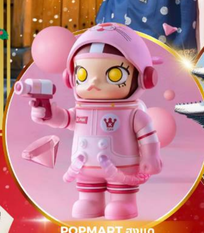
POP MART ฮงแด