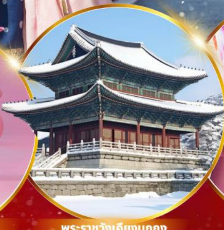
พระราชวังเคียงบกคุง